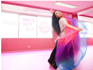
yuie 1987年9月9日(36) 指導クラス:ペリーダンスフィジカル 歴:ペリーダンス13年 健康的な身体作りをしています