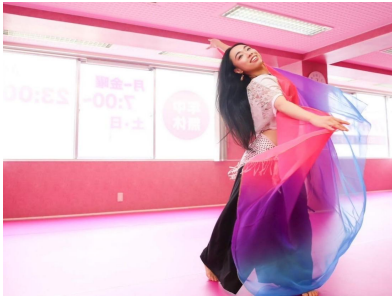
yuie 1987年9月9日(36) 指導クラス:ペリーダンスフィジカル 歴:ペリーダンス13年 健康的な身体作りをしています