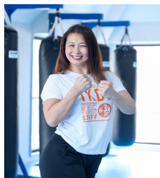
TOMO 8月1日 指導クラス:キックボクシング 競技:キックボクシング 気になることは何でも聞いてください！