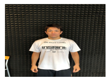
我謝 真人 1991年8月22日(30) 指導クラス:キックボクシング 格闘技歴:キックボクシング6年 楽しみながら強くなりましょう